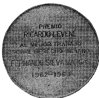
Medalla del "Premio Ricardo Levene". Anverso común y los dos reversos